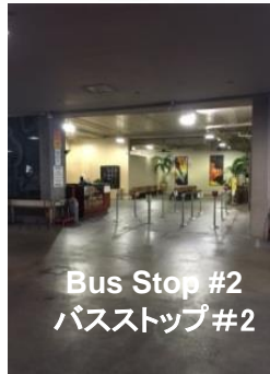
Bus Stop #2 バスストップ #2

T Galleria by DFS Inside / Garage Level T ギャラリー by DFS 建物内 / ガラージュレベル