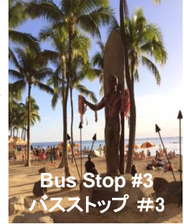
Bus Stop #3 バスストップ #3

Duke Statue On Kalakaua Ave. across from Hyatt Regency Waikiki デュークカハナモク像前 カラカウア通り沿い