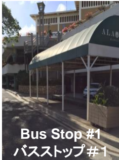
Bus Stop #1 バスストップ #1

Ala Moana Shopping Center Corner of Atkinson Dr. right by the stairs going up to Macy's アラモアナショッピングセンター アトキンソン通り側にある緑色のシャトル停留場